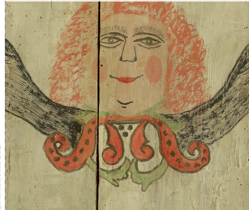
Foto: Detail der Kirche Steinbach (Radeburg, OT Bärnsdorf)

16. Februar 2019 | 9:30 Uhr – 16:30 Uhr Evangelische Akademie Meißen